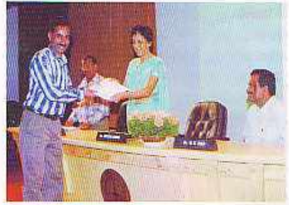
जबलपुर क्षेत्रीय इकाई में हिन्दी दिवस पर पुरस्कार वितरण समारोह

रूप से हिन्दी दिवस मनाया। इस उपलक्ष्य में अनेक प्रकार की हिन्दी प्रतियोगिताओं का आयोजन किया गया जैसे टिप्पण-प्रारूपण प्रतियोगिता, निबंध प्रतियोगिता, वाद-विवाद प्रतियोगिता एवं हिन्दी टंकण प्रतियोगिता। निबंध प्रतियोगिता का विषय था- 'वर्तमान संदर्भ में न्यायपालिका वनाम कार्यपालिका' एवं वाद-विवाद प्रतियोगिता में विषय था- 'परमाणु करार'। इन प्रतियोगिताओं का एकमात्र उद्देश्य कर्मचारियों एवं अधिकारियों को अपना सरकारी कामकाज राजभाषा हिन्दी में करने हेतु प्रेरित करना था। उल्लेखित प्रतियोगिताओं में अनेक कर्मचारियों ने पूर्ण उत्साह के साथ भाग लिया।