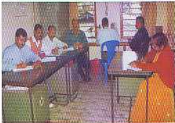
सोनापुर क्षेत्रीय इकाई में हिन्दी दिवस संबंधी गतिविधियों के चित्र

संबंधित प्रतियोगिता में संस्थान के अधिकारियों